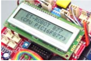
LCD DISPLAY 16 ตัวอักษร 2 บรรทัด