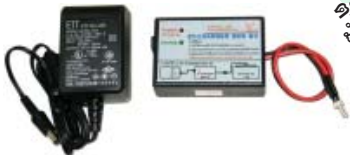
ชุด ET-CHARGER BOX 6V